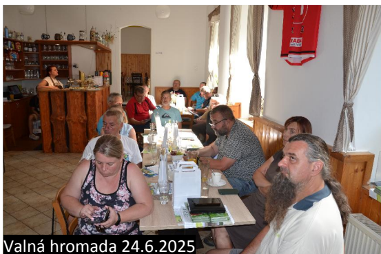
Valná hromada 24.6.2025