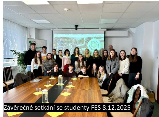
Závěrečné setkání se studenty FES 8.12.2025