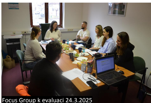
Focus Group k evaluaci 24.3.2025