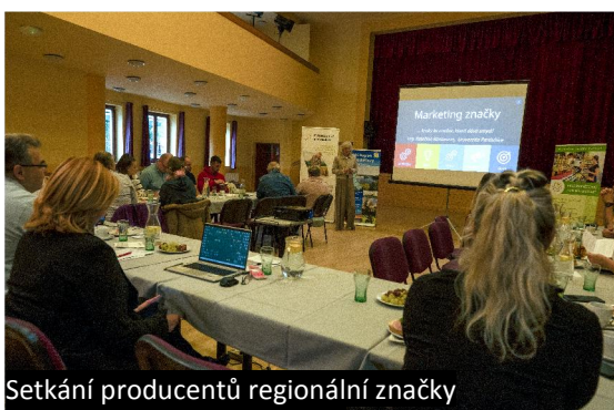
Setkání producentů regionální značky Kraj Pernštejnů® 15.10.2025