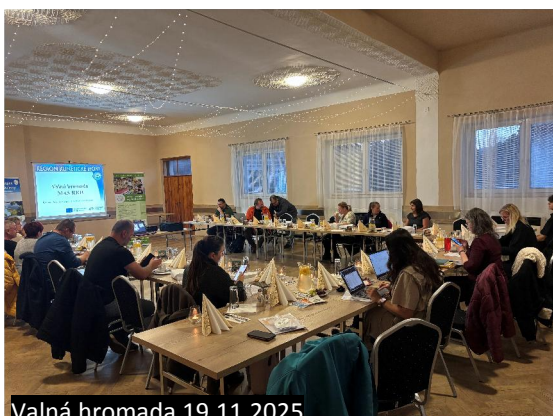
Valná hromada 19.11.2025