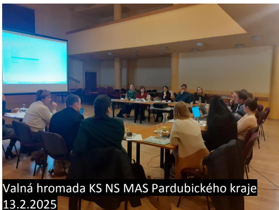
Valná hromada KS NS MAS Pardubického kraje 13.2.2025