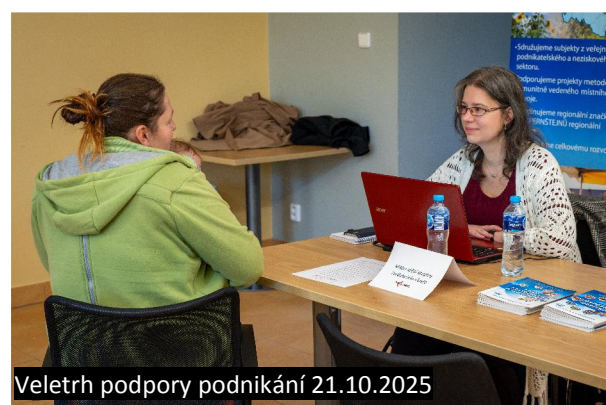
Veletrh podpory podnikání 21.10.2025