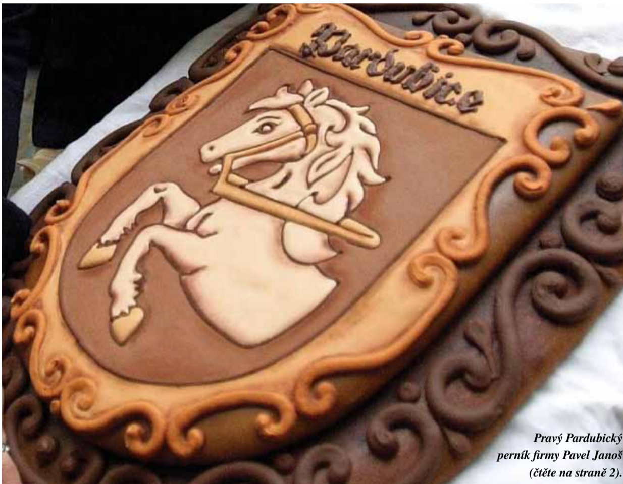
Pravý Pardubický perník firmy Pavel Janoš (čtěte na straně 2).